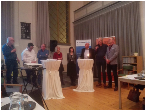
Lucaskerk Winkel, diaconie